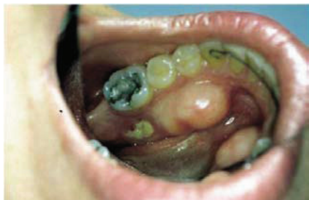
Slika 3. Avaskularna nekroza dijela mandibularnog torusa u pacijenta s dijagnozom BRON-a (Stadij I).

Dokazano je da je rizik za pojavu nuspojava u korelaciji u odnosu s prisutnošću dušičnih lanaca u sastavu lijeka, kumulativnim učincima doza lijeka, vremenom trajanja terapije, prisustvošću medicinskog i dentalnog komorbiditeta, kemoterapijom te izvođenje invazivnih stomatoloških zahvata. Pacijenti koji su pod parenteralnom terapijom bifosfonatima i podvrgnuti dentoalveolarnoj operaciji, imaju sedam puta veći rizik od obolijevanja od BRON-a nego pacijenti koji nisu podvrgnuti operaciji. Lezije se češće javljaju na mandibuli nego na maksili (2:1) i češće na područjima s tanjom mukozom, koštane prominencije kao što je torus, egzostoze i milohioidni