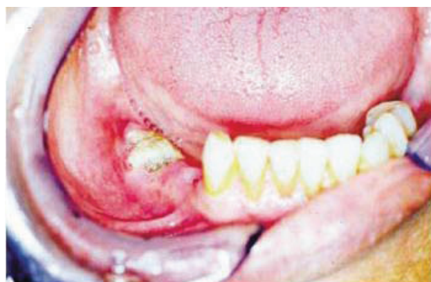
Slika 4. Izložena nekrotična kost u pacijenta s dijagnozom BRON-a i kliničkim znakovima infekcije (Stadij II).

Za pacijente kojima se indicira terapija bifosfonatima potrebna je stomatološka priprema pacijenta u smislu evaluacije i sanacije postojećeg oralnog zdravlja, invazivni stomatološki zahvati najmanje mjesec dana prije početka terapije, redoviti kontrolni pregledi svaka 3 mjeseca te antibiotska profilaksa pri izvođenju invazivnog zahvata ako pacijent uzima neke lijekove. Tijekom trajanja terapije ipak se preporučuje izbjegavati invazivne zahvate na čeljustima ako je to moguće, što znači dobro procijeniti rizik zahvata i je li on uistinu nužan. U slučaju nastanka nuspojava, dok je pacijent pod terapijom, njihovo liječenje je uglavnom simptomatsko u smislu uklanjanja bolova, ali i sprječavanja mogućeg širenja. Postupci sekvestrektomije