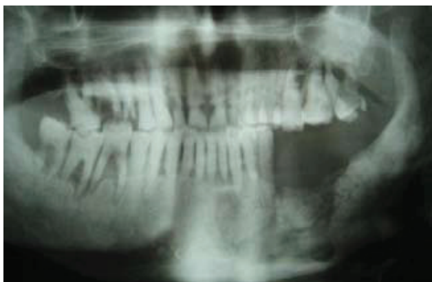
Slika 5. Ortopantomogram mandibularne osteonekroze pacijenta na parenteralnoj terapiji bifosfonatima nakon ekstrakcije zuba 36 s nalazom osteonekroze ispod zuba 46, 47 i 48 (Stadij II.).