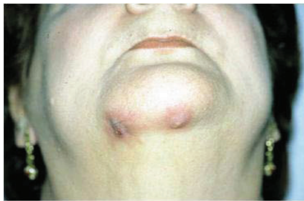
Slika 6. Ekstraoralna fistula kod pacijenta s dijagnozom BRON-a (Stadij III.).

i hiperbarične oksigenacije dokazano su u većini slučajeva tada neučinkoviti. Trajna terapija takvih pacijenata podrazumijeva ordiniranje penicilinskih preparata i ispiranje usne šupljine 0,12% klorheksidinom, kod osteomijelitisa liječenje metronidazolom, a kod težih infekcija kombinacijom penicilina i metronidazola ili kinolonskog preparata ili eritromicina / klindamicina s metronidazolom. Mnogi autori dokumentiraju da su lezije kosti i oralne sluznice u tim slučajevima najčešće kolonizirane aktinomycetama. (slika 2.) Kod pacijenata koji su pod peroralnom terapijom bifosfonatima manje od tri godine i nemaju kliničkih rizičnih čimbenika, nije potrebo odgađati planirane operacije. Kod pacijenata koji također dobivaju terapiju bifosfonatima manje od tri godine, ali zato uzimaju kortikosteroide trebali bi prekinuti uzimanje oralnih bifosfonata na tri mjeseca prije operacije ako tjelesno stanje to dopušta. Pacijenti koji su pod terapijom oralnih bifosfonata duže od tri godine bez pratećih steroidnih lijekova, terapija bi trebala biti prekinuta tri mjeseca prije operacije te nastavljena tek kada se javi koštano cijeljenje.