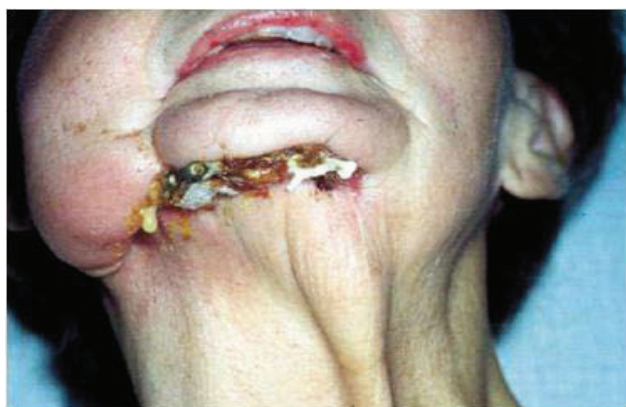
Slika 7. Prijelom donje čeljusti kod pacijenta s dijagnozom BRON-a nakon sanacije i infekcije (Stadij III.).

malno invazivnim postupcima kod bolesnika koji su pod terapijom bifosfonatima.